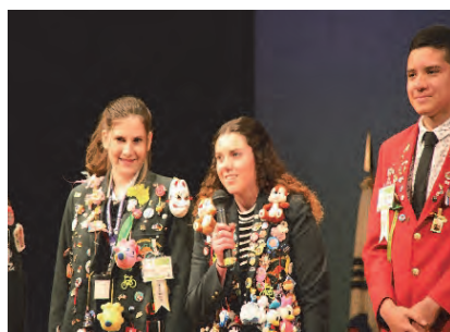
・魚津西RC受入交換留学生