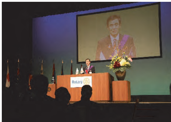
・高畠地区大会実行委員長の挨拶